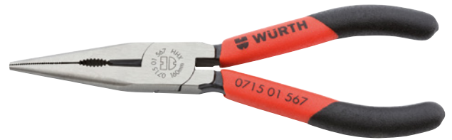
Slika je primjer